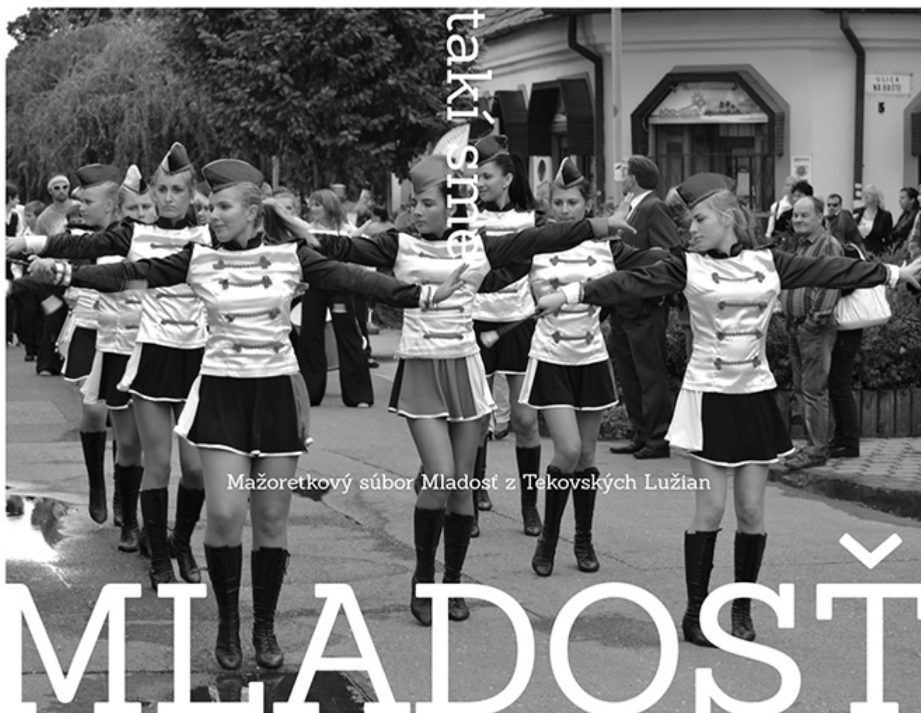
Madžoretkový súbor Mladosť z Tekovských Lužian

Za spoluprácu ďakujeme vedeniu obce a jeho zamestnancom v Starom Tekove, Tekovských Lužanoch, Kozárovciach, Santovke a v mestách Levice, Šaha a Želiezovce. V neposlednom rade ďakujeme za finančnú podporu Vyšehradskému fondu, Slovenským elektrárňam, Ministerstvu kultúry SR, Úradu vlády SR, Mestu Levice, Poľskému inštitútu a Nitrianskemu samosprávnemu kraju.