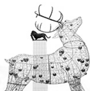
Boris Cambel - Symboly II, skupina, Čestné uznanie