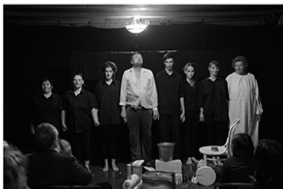
Divadelný súbor z Kremnice, predstavenie - Moskva-Petušky