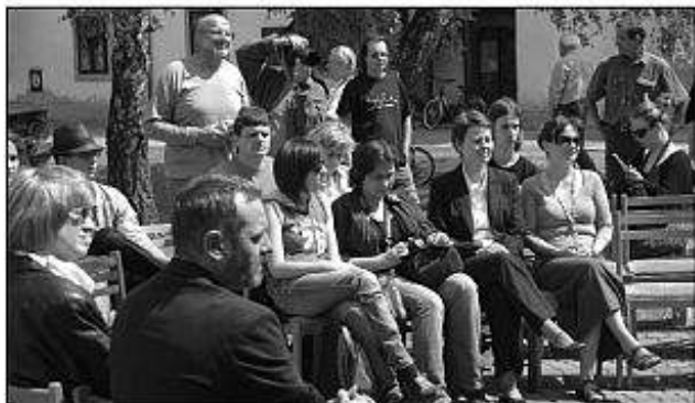
■ Slávnostné otvorenie Dní fotografie v Leviciach na nádvorí hradu.

V podvečer sme v kaviarni Kontakt obdivovali ucelenú kolekciu českého fotoklubu Vývojka z Českých Budějovic.