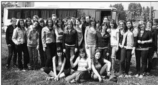
■ Študenti z levických stredných škôl na výstave v Nitre.