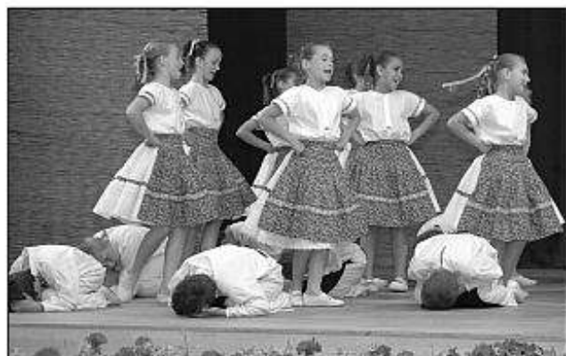
■ Detský folklórny súbor Hronček z Veľkých Kozmáloviec.