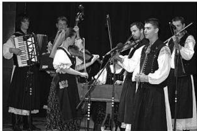
■ Otvorenie festivalu Ľudovou hudbou Ponitran z Nitry.

Aj v ďalších mestách okresu sa mali naši folkloristi čím prezentovať. Šahy reprezentovali FS Búzavirág z Plášťoviec a Detský folklórny súbor Napsugár, ktorý pôsobí pri ZŠ s vyu-