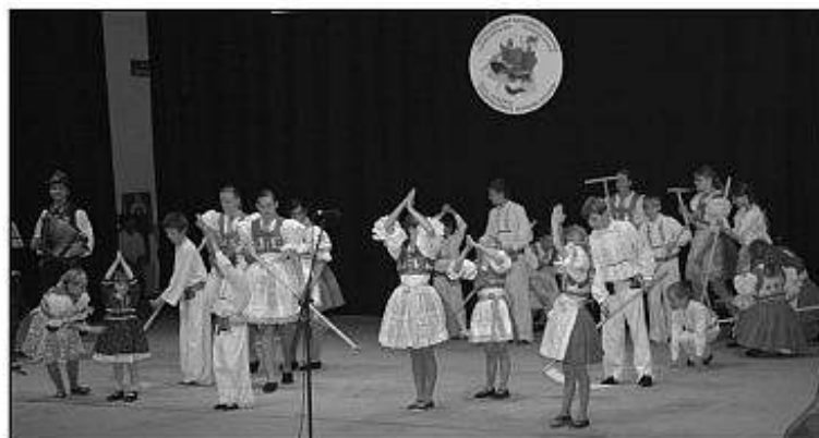
■ DFS Kyjovánek z českého Kyjova.