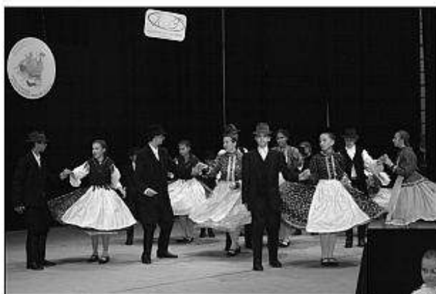
■ FS Kincső zo Železoviec.