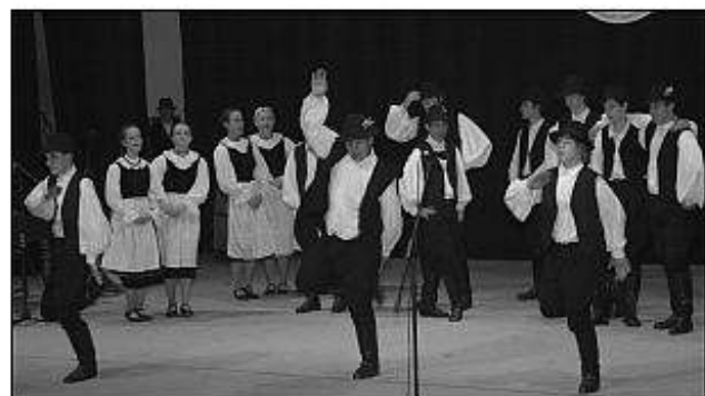
■ Vľavo: Campana Batucada - brazílska samba z Nitry v uliciach Levíc. ■ Vpravo FS Harmónia z Györu (MR).