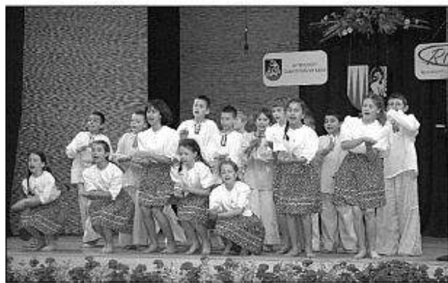
■ Detský folklórny súbor Klnka z Komjalic.