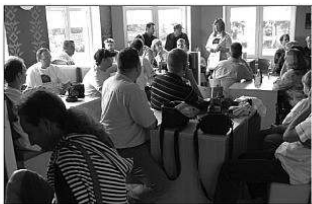
■ Začiatok Fotomaratónu.