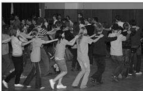
■ Večer národov.