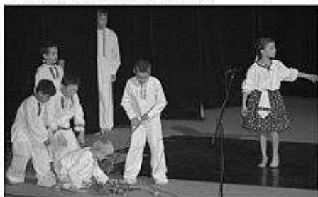
■ Detský folklórny súbor Kuraľanček z Kuralian.

Kultivované slovo prišlo s Celkom malým divadlom zo Žemberoviec, ktoré patrí nesporne k zaujímavým zjavom na slovenskej amatérskej divadelnej scéne. Divadlo sa špecializuje výsostne na inscenácie komorného charakteru a za pár rokov svojej existencie zaznamenalo značné úspechy. V Kozárovciach nám herci zahrli dve scény z hry