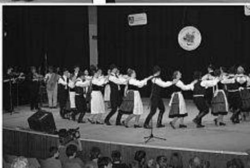
■ FS Hamónia z Gyoru (MR).