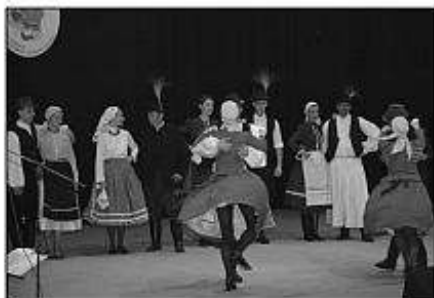
■ Forgatós Kamara z Gyoru (MR).