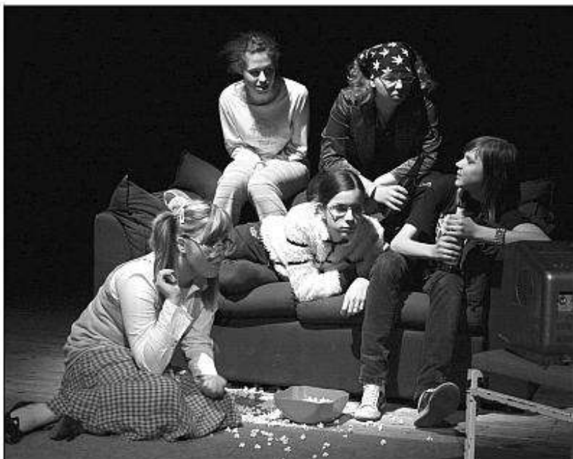
■ Alica v krajine zázrakov v podaní Divadla NAPOČKANIE z Tlmáč.