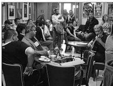
■ Vernisáž výstavy levického fotoklubu FOTOGRAVITY v Kaviarni Na kus reči v Leviciach.