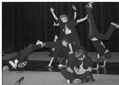
■ Fantoms crew - break dance z Mane.