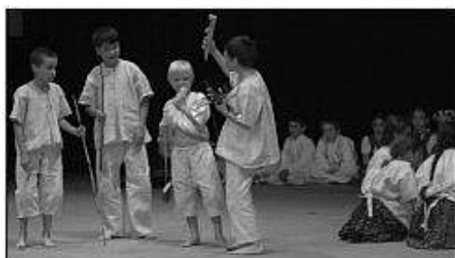
■ DFS Kuraľanček z Kuralian.