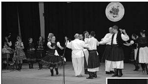
■ Limbačka z Levíc.