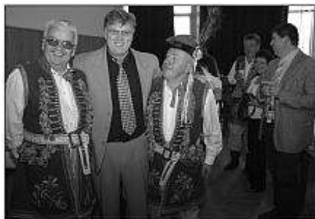
■ Poľský folklórny súbor Jadowniczanie v rámci VEČERA NÁRODOV v Dome kultúry Družba v Leviciach.

V nedeľu dopoludnia sa konala za účasti zahraničných hostí slávnostná svätá omša v rímskokatolíckom kostole svätého Michala a slávnostné služby Božie v kostole Reformovanej cirkvi.