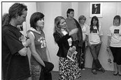
■ Na snímke hore výstava v Synagóge v Sáhách.