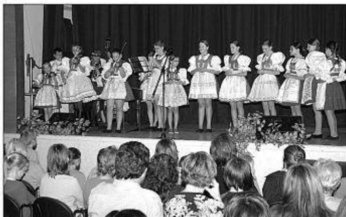
■ Detský folklórny súbor Kyjovánk z Českej republiky v Šahách.

V Želiezovciach v dopoludňajších hodinách za účasti všetkých ZŠ a Gymnázia s VJM na štadióne oslávili Medzinárodný deň detí, kde sa v rámci kultúrneho programu predstavili hostia z Maďarska, t. j. MFS Regős a FS Forgatós Kamara. Vo večernom programe sa okrem zahraničných hostí predstavili domáci MFS Kincső