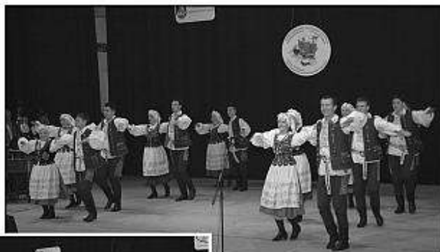
■ V rámci galaprogramu sa v DK Družba v Leviciach predstavil aj FS Jadownczanie z Poľska.