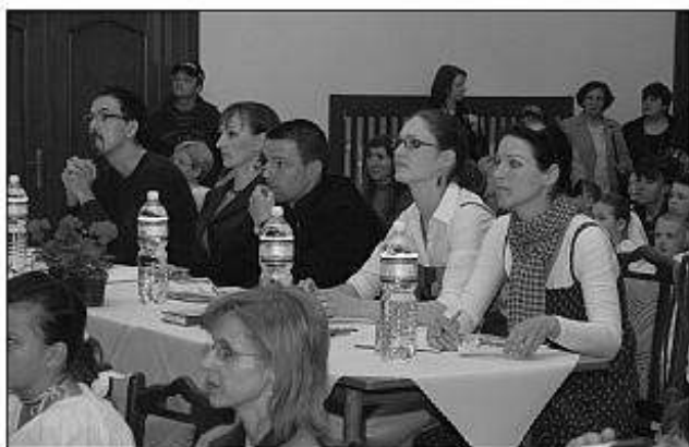
■ Odborná porota.