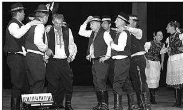
■ FS Praslica z Kozároviec.