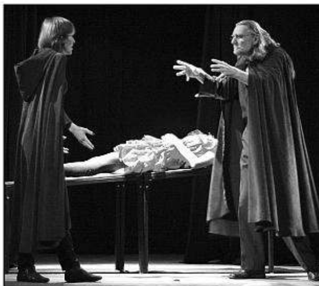
■ Inscenácia Nádych v podaní Divadla DISK.

3. miesto a odporúčania na Scénickú žatvu 2009 v Martine - Divadelnému súboru Levočská divadelná spoločnosť pri MsKS Levoča s inscenáciou Pastier