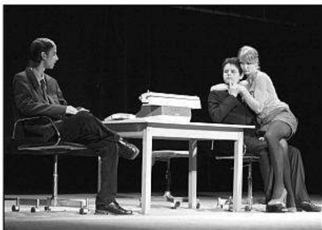
■ Na fotografii vľavo Divadelný súbor Gymnázia Andreja Vrábla z Levíc.