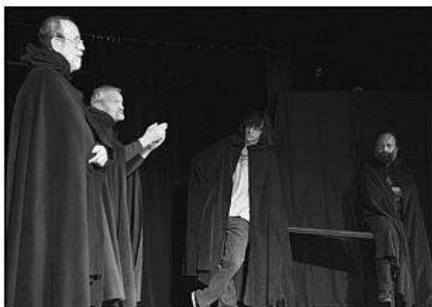
■ Spoločne s Trnavským divadlom DISK porota v Timačoch ocenila Divadlo Commedia Poprad, DS Daxner Tisovec a DS Levočská divadelná spoločnosť pri MsKS Levoča.