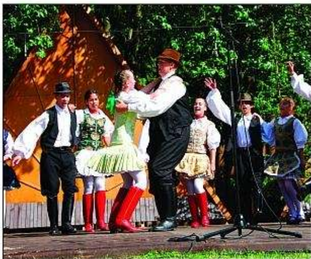
■ Detský folklórny súbor Kincso z Želiezoviec pod Likavským hradom.