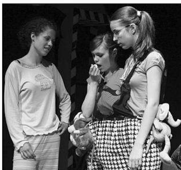
■ Fotografia vpravo zachytáva Divadlo NAPOČKANIE z Tlmáč.