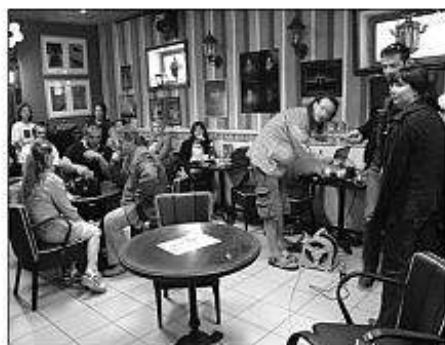
■ Vyhodnotenie Fotomaratónu v Kaviarni Na kus reči.