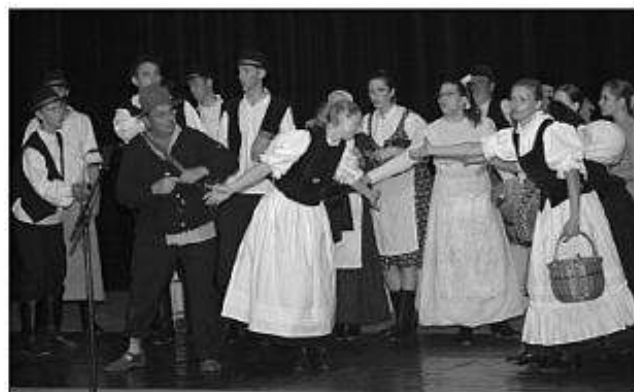
■ FS Vajrab z Pukanca.