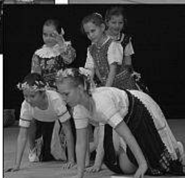
■ DFS Podlužianka z Levíc.