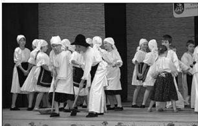
■ Detský folklórny súbor Fatranček z Nítry.