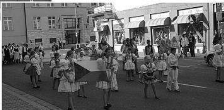
■ Krojovaný sprievod ulicami Levíc, v popredí DFS Kyjovánek z ČR.

vané všetkými účastníkmi tohto podujatia. Po celé štyri dni sa spoločným spevom, tancom a hrami odstraňovali pomyselné hranice. Pod posolstvom „TAKÍ SME“ sa vytrácali rozdiely štátov a kultúr a vznikalo nové humanitné spo-