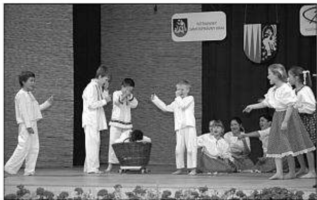
■ Detský folklórny súbor Kuraľanček z Kuralian.

predovšetkým výber repertoáru a jeho spracovanie vzhľadom na vek, možnosti a schopnosti detí a cieľom neodškriepiteľne bolo podporovať rozvoj detských folklórnych súborov a zvyšovať ich umeleckú úroveň, popularizovať výchovu ľudovým umením, šírenie ľudovej kultúry, jej rozvíjanie a uchovávanie pre nasledujúce generácie.