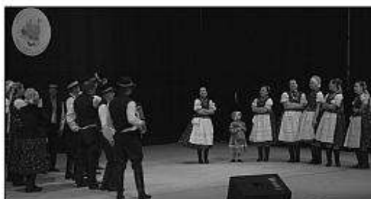
■ Vľavo: FSK Praslička z Kozároviec.