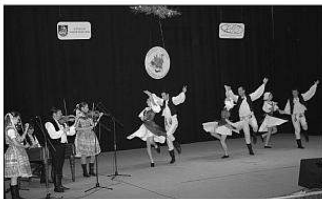
■ Vystúpenie timačských folkloristov z Vetry.