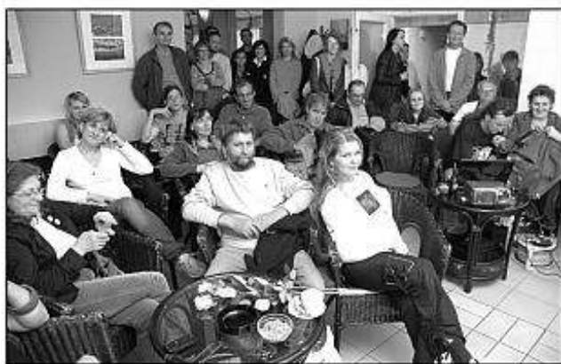
■ Beseda v Kaviarni na Korze.