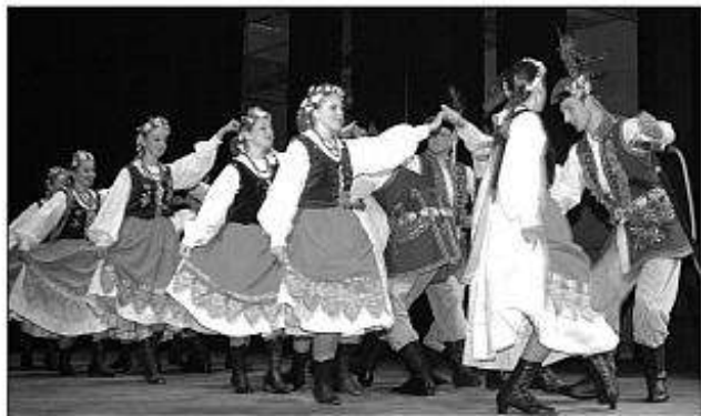
■ V Tlmačoch sa predstavil aj FS Jadowniczanie z Poľska.

V programe „...taki smel“ potom tradičnú kultúru nášho regiónu zahraničným hosťom predstavil FS Ponitran z Nitry pôsobiaci pri Univerzite Konštantína Filozofa v Nitre, predstavil sa ľudovými zvykmi z Tekova a z Ponitria.