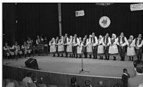
■ Vpravo: FS Jadowniczenie z Poľska.