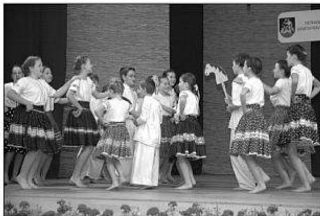
■ Detský folklórny súbor Tekovanček zo Starého Tekova.