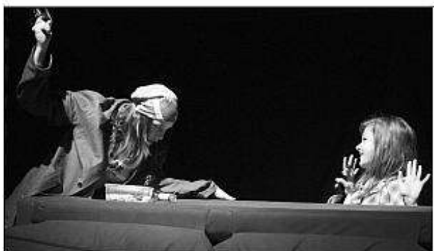
■ Divadlo mladých NAPOČKANIE Tímače.