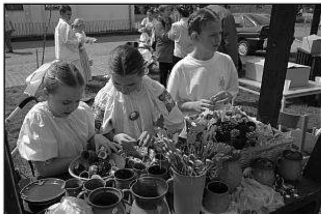
■ Tvorivé dielne počas prehliadky.