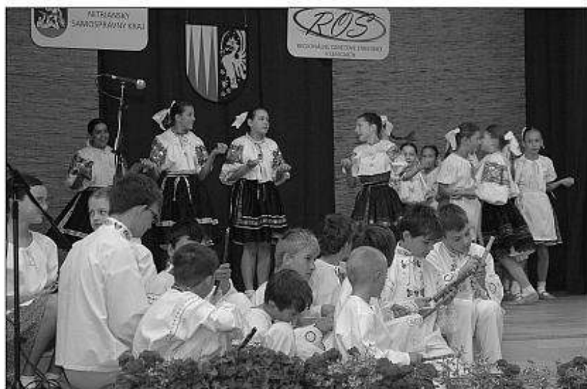
■ Detský folklórny súbor Žochárik z Topoľčian.