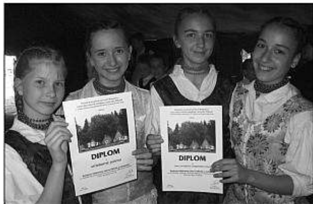
■ Ocenenie strieborným pásmom programu pre DFS Kincso.

Deľi boli úžasné, lešili sa na Likavku a oduševnené sme cvičili takmer každý deň. Konečne prišiel 13. jún a my sme sa ráno o šiestej vydali na dlhú cestu do Ružomberka. Po dlhej a únavnej ceste nás čakalo vystúpenie v silnej konkurencii DFS z celého Slovenska. Chceli sme byť dobrí (boli s nami i rodičia a prišiel nás podporiť aj pán starosta s manželkou), deti vystupovali s radosťou, boli prirodzené, spontánne a pásmo „Na kural'ských lúkach“ bolo odmenené obrovským potleskom a ocenením „Zlaté pásmo programu“. Zavládla obrovská radosť a eufória. Po príchode domov nám blahoželali všetci ľudia z obce a vyjadrovali nám svoje pocity radosť, hrdosť a vďaky, že sme vzorne reprezentovali školu, obec, okres, i kraj.