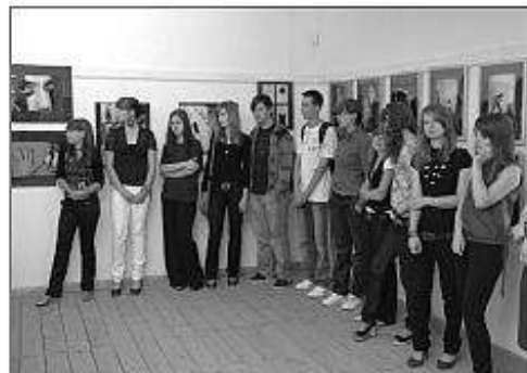
■ Otvorenie výstavy študentov SOŠ Ladislava Bielika Levice v Synagóge v Šahách.