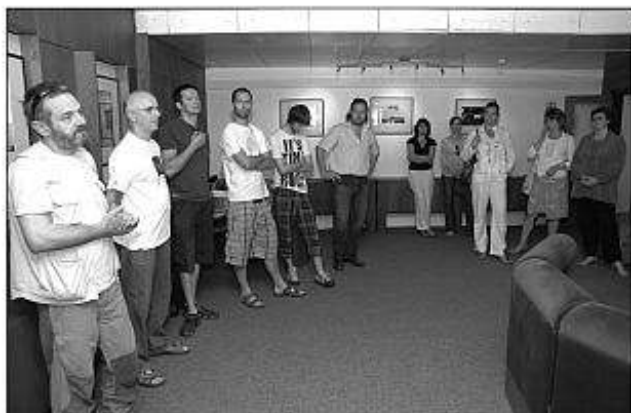
■ Spoločná výstava niekoľkých členov OZ FOTOGRAVITY v CK Junior na tému DSS Hrabiny.