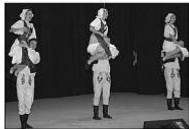
■ FS Vatra z Timáč.