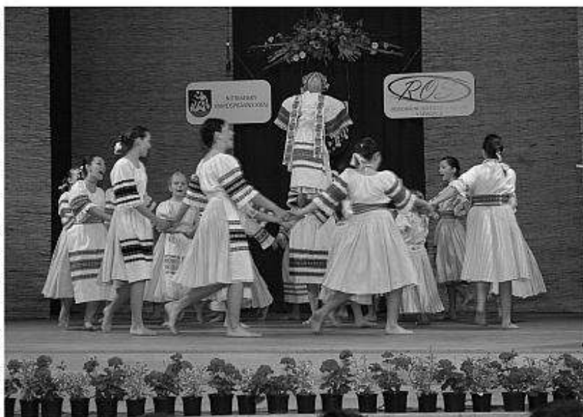
■ Detský folklórny súbor Dolinka z Mane.

Krajskej prehliadky sa zúčastnili len tie najlepšie kolektívy Nitrianskeho samosprávneho kraja: DFS Dolinka Maňa, DFS Fatranček Nitra, DFS Hronček Veľké Kozmálovce, DFS Tekovanček Starý Tekov, DFS Kuraľanček Kuraľany, DFS Klinka Komjatice a DFS Žochárik Topoľčany. Pritomným divákom bol prezentovaný