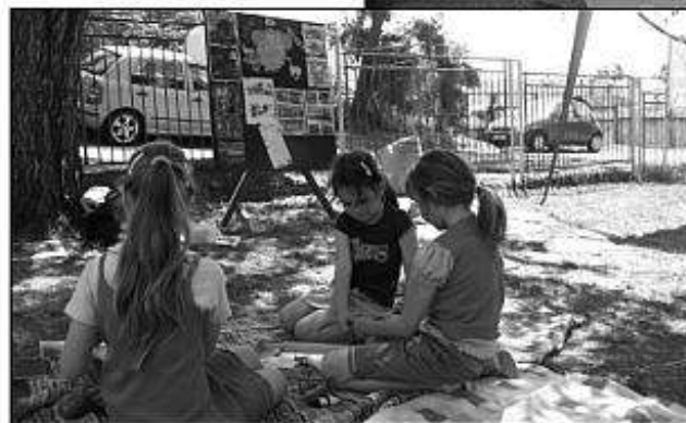
■ Environmentálna výchova v praxi.

potreby spoločenských, hospodárskych, divo žijúcich zvierat - všetko v kontexte humánneho prístupu ku zvieratám.