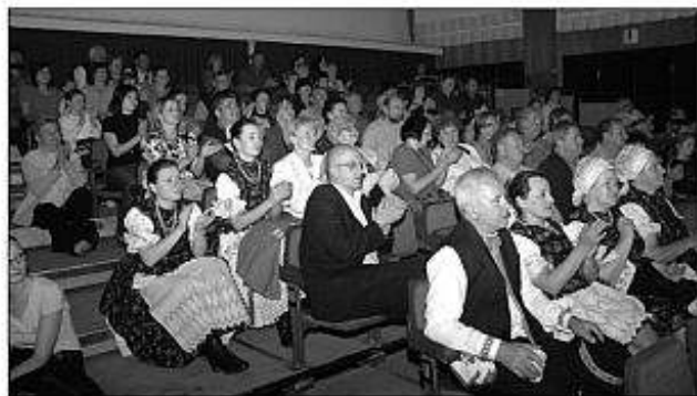
■ Diváci tleskajú účinkujúcim v sále DK v Timačoch na Lípniku.