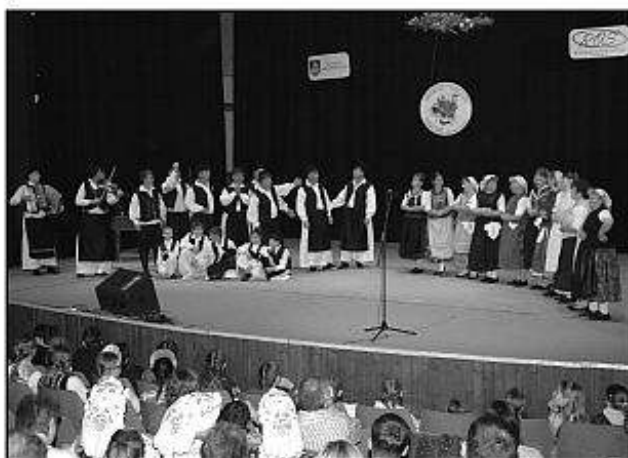
■ V rámci Galaprogramu sa predstavil aj súbor Búzavirág z Plášťoviec.