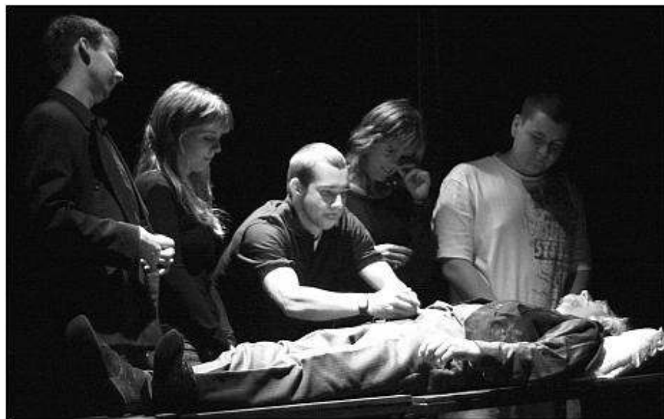
■ Divadlo DISK z Trnavy.

ny priestor na prezentáciu inscenačnej tvorby v neprofesionálnom divadle celej divadelnej sezóny.