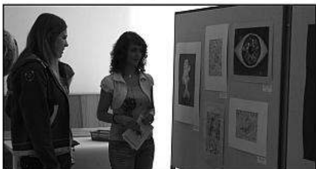
■ Prehliadka výstavy pod názvom Otvorme oči, veď je sa na čo dívať.