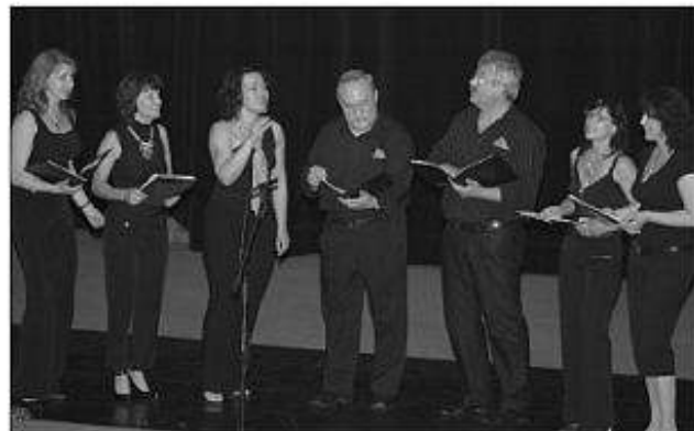
■ Anima Una - komorný spevácky zbor z Topoľčian.