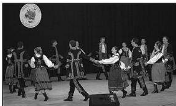
■ FS Jadowniczenie z Poľska.