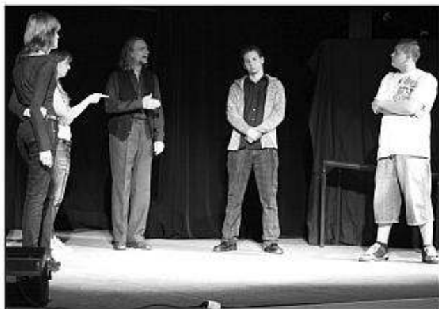
■ Členovia trnavského divadla DISK počas predstavenia v Tlmačoch.