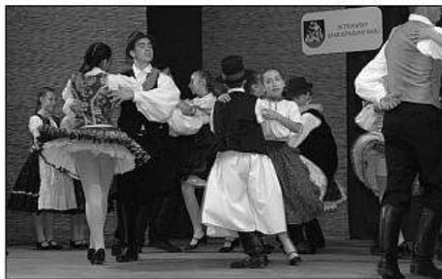
■ Hosť prehliadky - Folklórny súbor Kinčso zo Želiezoviec.