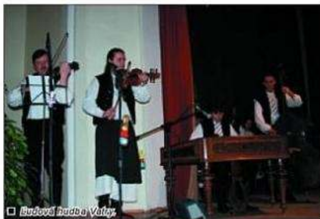
□ Budová hudba Vátra.