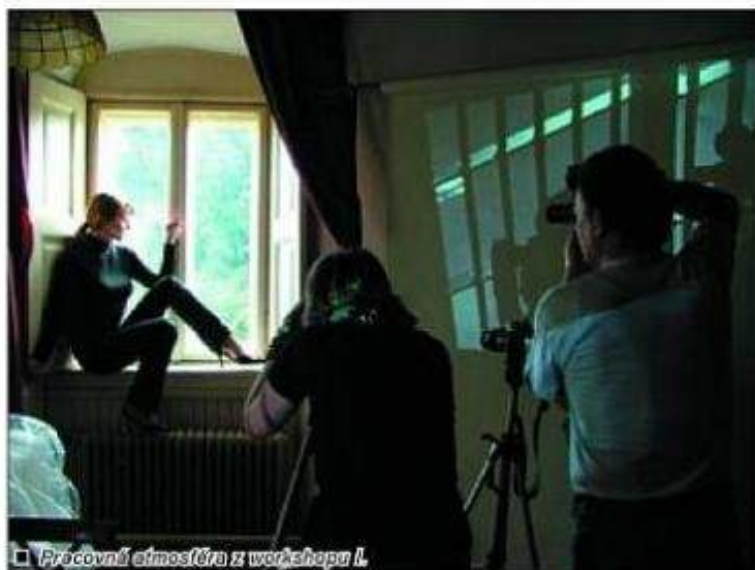
□ Pracovná atmosféra z workshopu I.