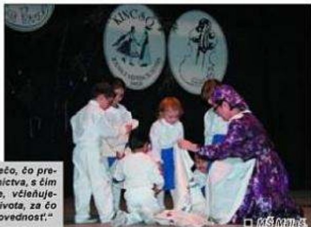
□ MS Malina.

„Dedičstvo je niečo, čo preberáme do vlastníctva, s čím sa stotožňujeme, včleňujeme do svojho života, za čo preberáme zodpovednosť.“