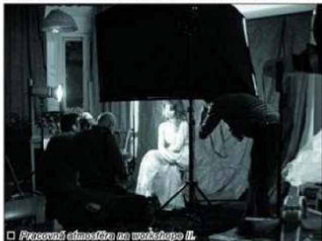
□ Pracovná atmosféra na workshopu II.