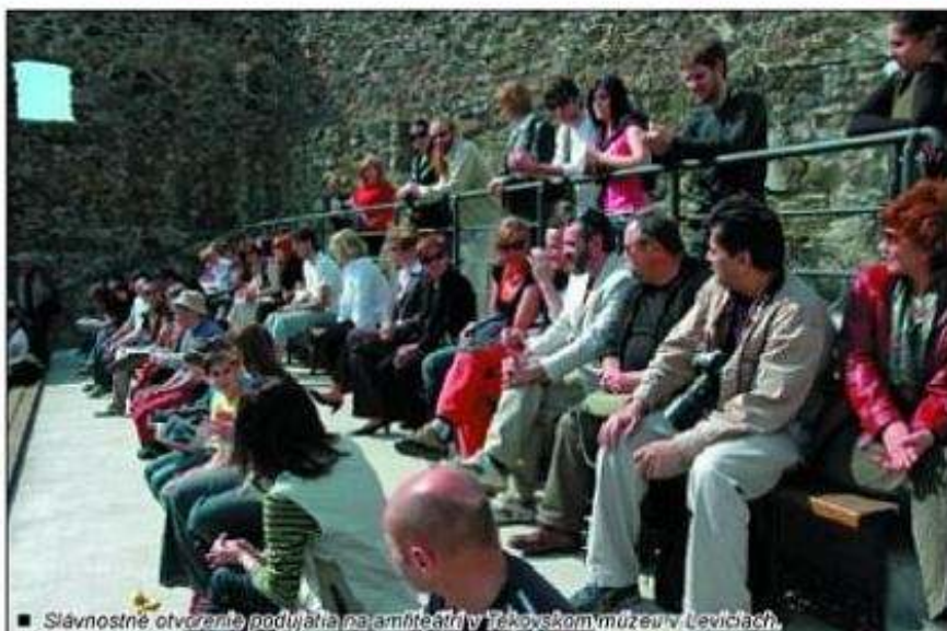
■ Slávnostné otvorenie podujatia na amfiteátri v Tekovskom múzeu v Leviciach.