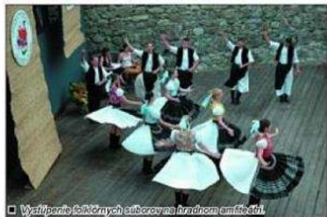
□ Vystúpenie folklórnych súborov na hrádnom amfiteátri