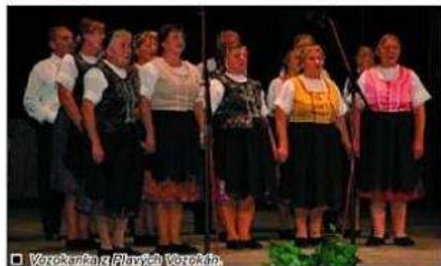
Vozokanka z Plavých Vozokán

Žemberoviec. V kategórii ľudová hudba zvíťazila Mladá ľudová hudba Folklórneho súboru Vatra z Timač. V kategórii spevácke skupiny si postup zabezpečila spevácka skupina Folklórneho súboru Lim-