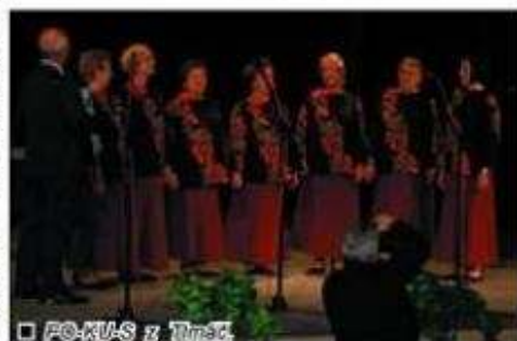
PO-KU-S z Timač

nica všetkých účinkujúcich v každej súťažnej kategórii bola 15 rokov, horná veková hranica stanovená nebola. Súťaž je trojstupňová v kategóriách: ľudové hudby dospelých od 3 do 12 členov, spev. skupiny dospelých od 4 do 12 členov, sólisti speváci a sólisti instrumentalisti.