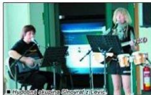
■ Hudebná skupina Sinovrat z Levíc

Podujatie sa konalo pod záštitou Veľvyslanectva Slovenskej republiky v Prahe a Nitrianskeho samosprávneho kraja. Účastníci absolvovali sériu niekoľkých výstav. Všetky organizoval Miro Švolík, uznávaný fotograf žijúci v Prahe, rodák z Kozároviec. S pozitívnym ohlasom sa stretla aj výstava, kde levický klub FOTOGRAVITY nadviazal kontakt s tamoj-