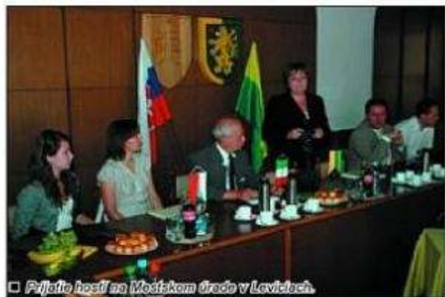
□ Prijatie hostí na Mošskom ťrade v Leviciach.

ližne 250 mladých ľudí zo štyroch štátov oboznámilo s levickým regiónom v širšom kontexte Slovenska a s tradíciami uchovávanými a sústavne oživovanými kultúrnymi hodnotami.