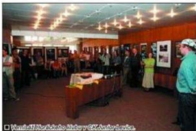
□ Vernisáž Moráckeho klubu v CK Junior Levica.