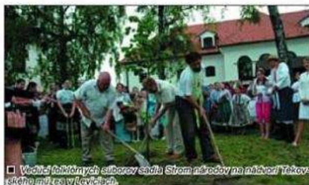
□ Vedúci folklórnych súborov sadia Strom národov na nádvorí Tekovského múzea v Leviciach.