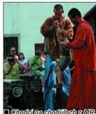
■ Chodci na chodítkoch z MR.