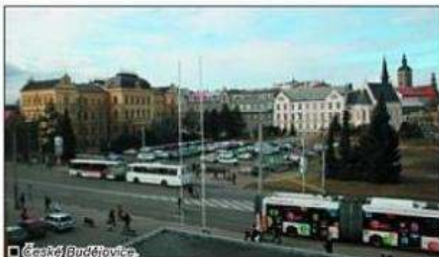
■ České Budějovice.

stavil svojou videoprojekciou. Tak sme popri zvučných menách ako Desmod, Horkýže slíže, Marián Varga, Vincent Hložník, či nitrianske Divadlo Andreja Bagara, mohli reprezentovať náš kraj a región.