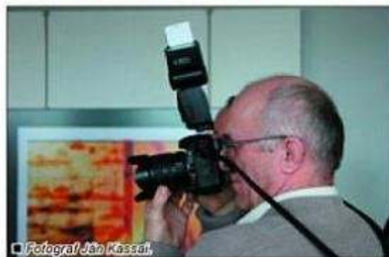
■ Fotograf Ján Kassal.

ri sa prezentovali v Českých Budějoviciach, je vyzrelá, od subjektívneho dokumentu až k výtvarnej fotografii. Ich spoločným znakom je, že pracujú v intenciách klasickej, analógovej fotografie. A práve zámerom tejto ich spoločnej prezentačnej výstavy bolo ukázať českej verej-