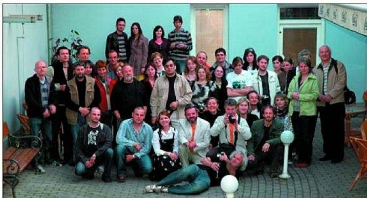
■ Spoločná fotografia zachytáva atmosféru dobrej spolupráce amatérskych a profesionálnych fotografov na medzinárodnom podujatí DNI FOTOGRAFIE V LEVICIACH 2008.

ČÍSLO 1 ROČNÍK I. OBČASNÍK REGIONÁLNEHO OSVETOVÉHO STREDISKA V LEVICIACH NEPREDAJNÉ ZRIAĐOVATEĽOM ROS V LEVICIACH JE NITRIANSKY SAMOSPRÁVNÝ KRAJ