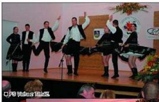
FS Vatra z Timáč.

Slávnostné otvorenie festivalu sa uskutočnilo 30. mája v Hoteli Lev. V rámci večera vystúpili domáce folklórne súbory FS Vatra z Timáč, FS Garammenti z Levíc, Detský folklórny