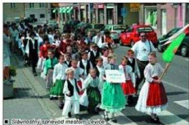
■ Slávnostný sprievod mestom Levice