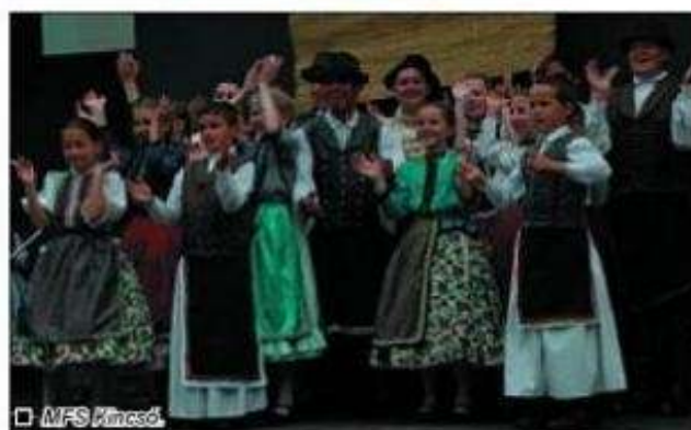
□ MFS Kincosé