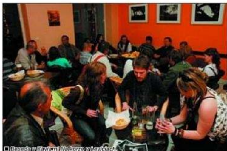
□ Beseda v Kaviarni Na korze v Leviciach.