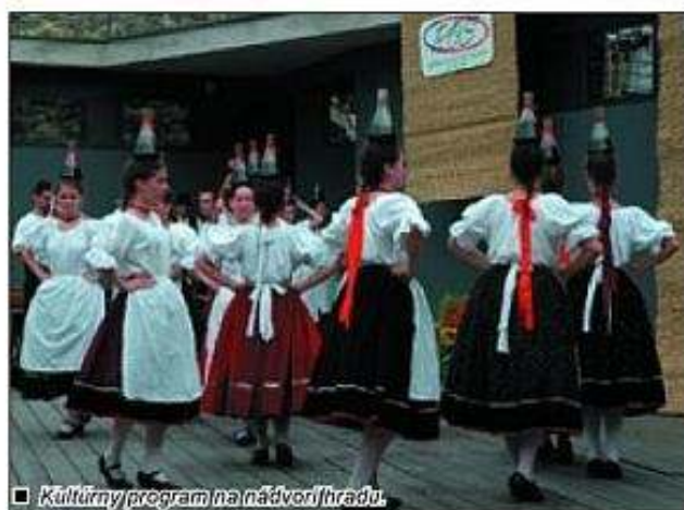
Kultúrny program na nádvorí hradu.

V duchovnej dielni pohybového umenia sa tak prib-